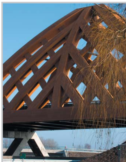
Most z borového dřeva, Sneek/ Nizozemí

Že se nám to podařilo, ukazuje následující tabulka, která dokládá další přednosti Aidolu HK-Lasur.